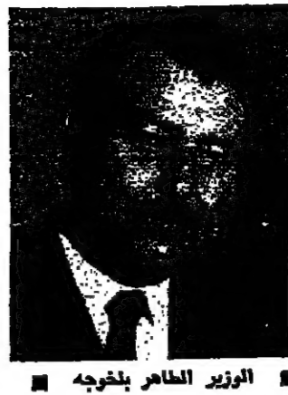
الوزير الحارث بن يحيى